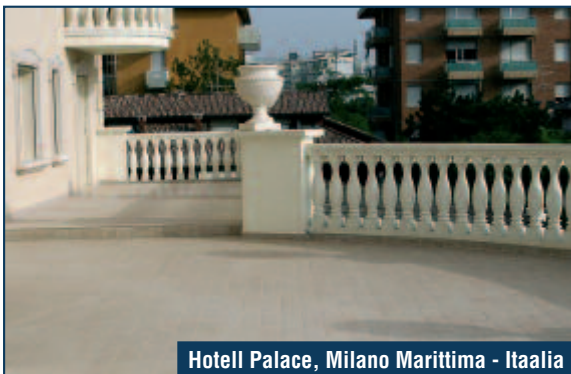
Hotell Palace, Milano Marittima - Itaalia