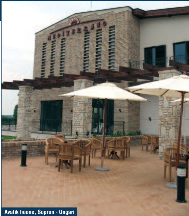
Avalik hoone, Sopron - Ungari

Selliste tingimuste täitmiseks on MAPEI loonud süsteemsed lahendused rõdude ja terrasside hüdrolatsiooniks nii uutes kui ka vanades hoonetes. Süsteemid on ka kõige ekstreemsemates tingimustes väga vastupidavad ja kauakestvad.