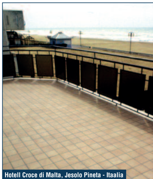
Hotell Croce di Malta, Jesolo Pineta - Itaalia