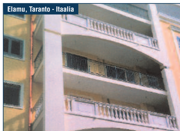
Elamu, Taranto - Itaalia