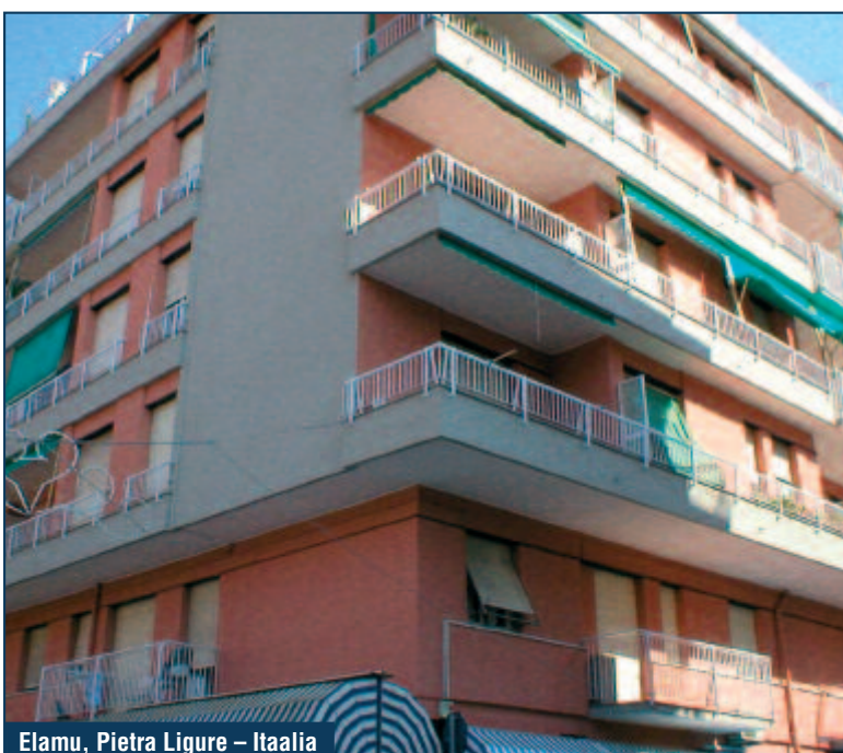
Elamu, Pietra Ligure - Itaalia