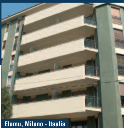
Elamu, Milano - Itaalia

Kui tekivad probleemid seisundi halvenemisega, siis ainuke võimalus on struktuuri renoveerida ning planeerida ette regulaarseid hooldustöid.