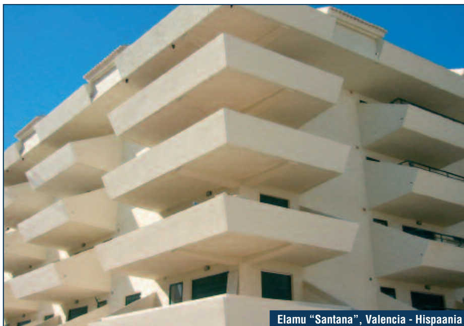
Elamu "Santana", Valencia - Hispaania

MAPEI pakub oma klientidele ammendavat tootevalikut selliste probleemide lahendamiseks.